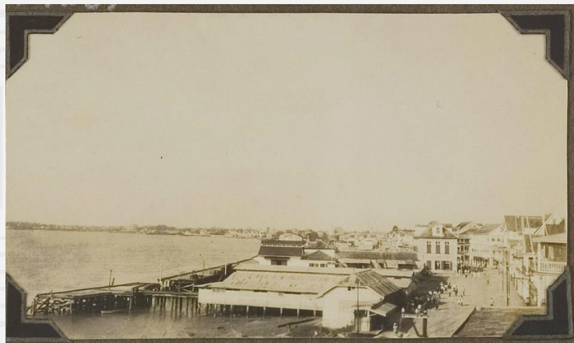
Uiterst links:: de bebouwing langs de oever van de Waterkant waarvan de funderingen afkomstig zijn