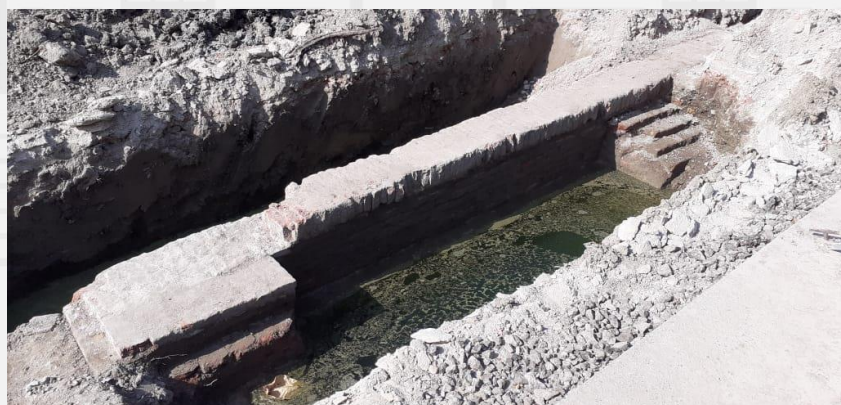
Deel van de bakstenen funderingen

Een tweede recente ontdekking is het blootleggen van bakstenen funderingen, welke zich onder het wegdek op enkele meters afstand van de schelpstenen kademuur bevinden. Onderzoek heeft uitgewezen dat deze bakstenen funderingen afkomstig zijn van twee oude loodsen die ongeveer lagen tegenover de Centrale Bank van Suriname (CBvS). Op oude foto's van ca. 1923 zijn de loodsen afgebeeld.