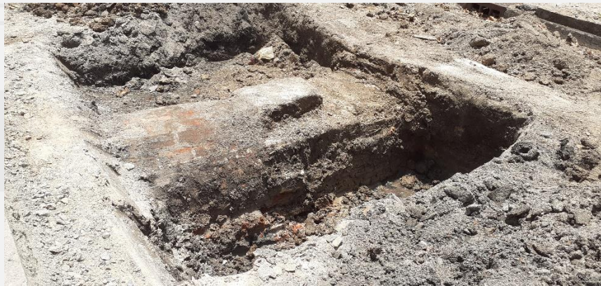
Gewelfde bakstenen riolering onder het asfalt van de Waterkant

De diverse vondsten worden momenteel gedocumenteerd. Het ligt in de bedoeling om in het nieuw aan te leggen trottoir stylistisch de kademuur weer te geven middels een andere kleur bestrating. Deze zal dan als een rechte lijn te zien zijn precies boven op de lokatie waar de kademuur loopt. Een ander voorstel is, om een deel van de kademuur, welke zal moeten wijken voor de aanleg van een rioolput, tentoon te stellen bij de gerehabiliteerde Waterkant.